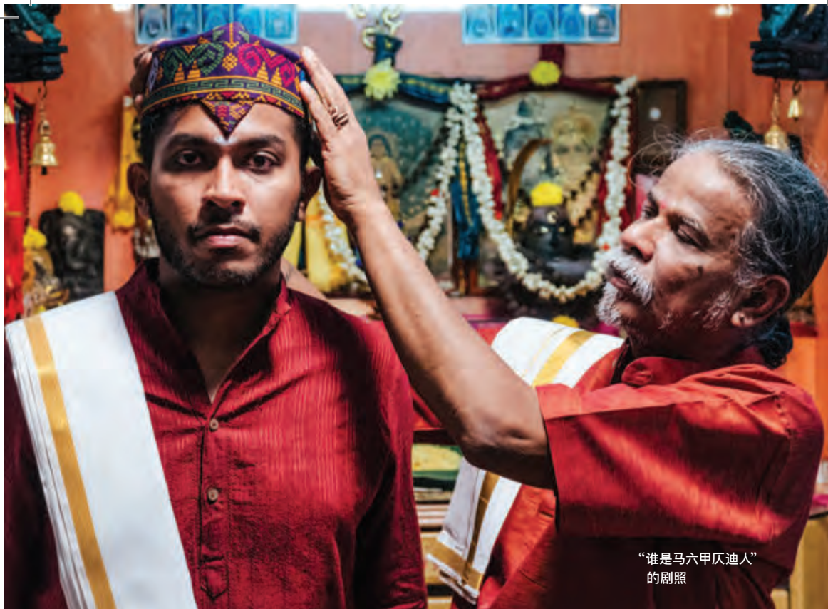
“谁是马六甲仄迪人” 的剧照