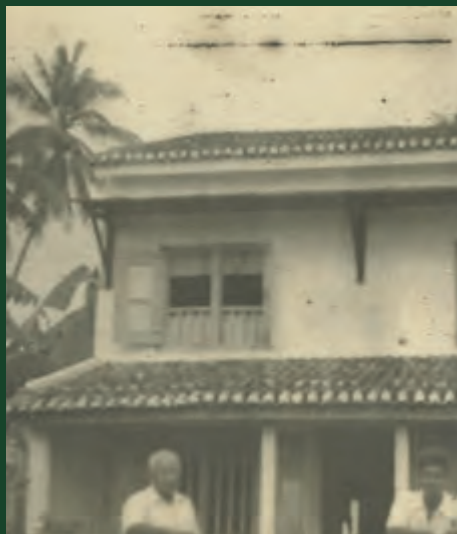
艾恩·索玛森达让位于惹兰雅佳美浪174号的住家照片 1947年，马来西亚马六甲