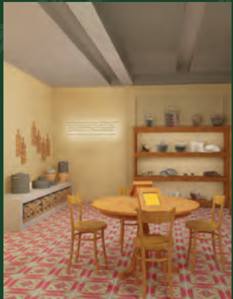
仄迪 (Chetti) 厨房的艺术效果图

仄迪族群的饮食习惯受印族及马来族饮食文化和烹饪手法的影响，各种场合皆有各式各样的美味佳肴登场。他们一般会在烹饪过程中，以传统印度香料搭配峇拉煎（虾酱）、香茅、南姜、班兰叶和椰奶等别具马来风味的食材，以制作味道独特的仄迪美食。