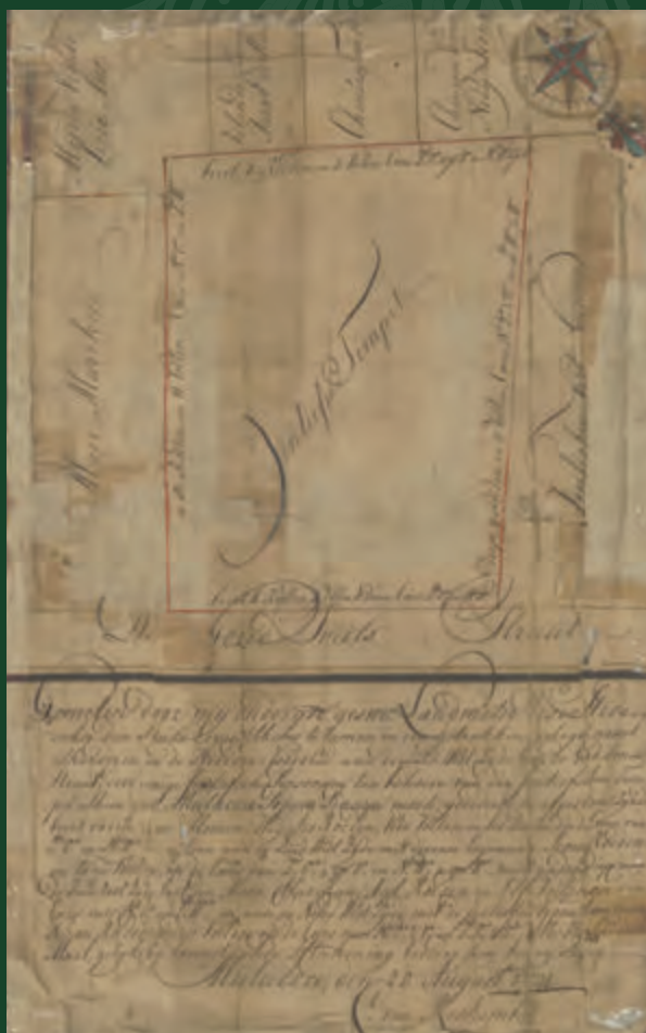
马六甲兴都庙的土地权证 1781年8月20日（荷兰人统治时期） 马来西亚马六甲

15世纪的马六甲是一个繁荣的贸易港，吸引世界各地的商人前来经商。来自南印度科罗曼德海岸的商人在此处落脚后，与当地的马来及华人女子通婚，而他们的后裔在马六甲苏丹王朝以及葡萄牙人、荷兰人和英国人统治时期形成了一个独特的群体。