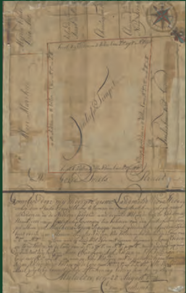
Geran Tanah bagi Kuil Sri Poyatha Venayagar Moorthi 20 Ogos 1781, Zaman Belanda, Melaka, Malaysia

Dalam kurun ke-15, Melaka adalah sebuah pusat dagangan entrepot yang sibuk dan menjadi tumpuan pedagang daripada seluruh dunia. Pedagang India Selatan yang tiba dari Pantai Coromandel telah berkahwin dengan wanita Melayu dan Cina tempatan. Mereka membentuk masyarakat Chetti Melaka yang dapat bertahan sepanjang pemerintahan Kesultanan Melaka yang dituruti dengan pemerintahan Portugis, Belanda dan Inggeris berabad-abad lamanya.