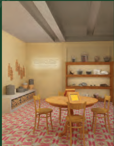
Lukisan artis yang menggambarkan dapur Chetti

Masakan Chetti Melaka merupakan kacukan unik masakan India, Melayu dan Cina yang pelbagai hidangan untuk setiap majlis. Untuk masakan Chetti Melaka, rempah tradisional India biasanya digabungkan dengan bahan-bahan Melayu bahan-bahan Melayu seperti belacan, serai, lengkuas, daun pandan dan santan untuk menghasilkan masakan Chetti yang unik.