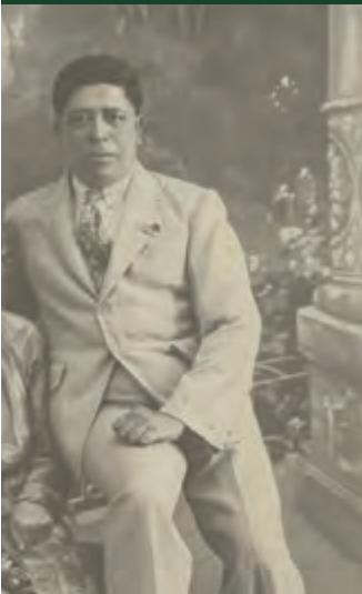
Agamee apura mee Chitty