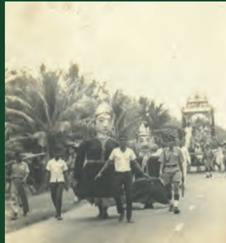
Gambar Perarakan sempena pesta Sembahyang Dato Chachar 1970-an, Melaka, Malaysia