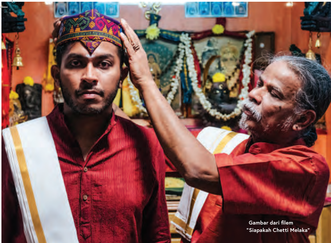
Gambar dari filem "Siapakah Chetti Melaka"