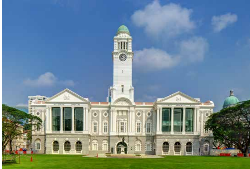
维多利亚剧院及维多利亚音乐厅