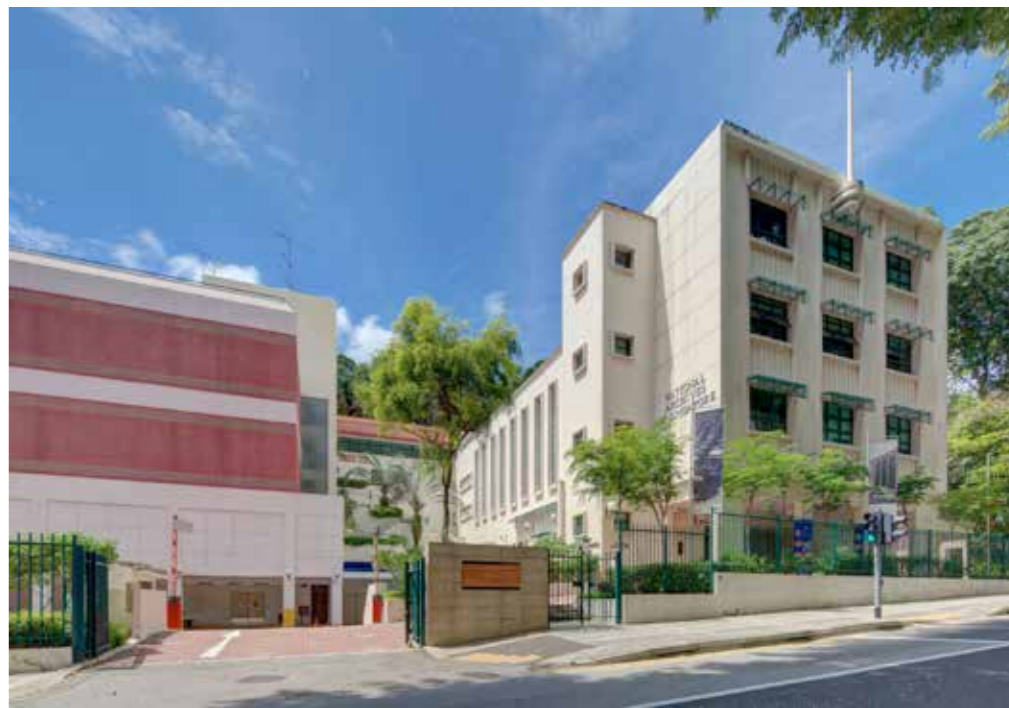
新加坡国家档案馆