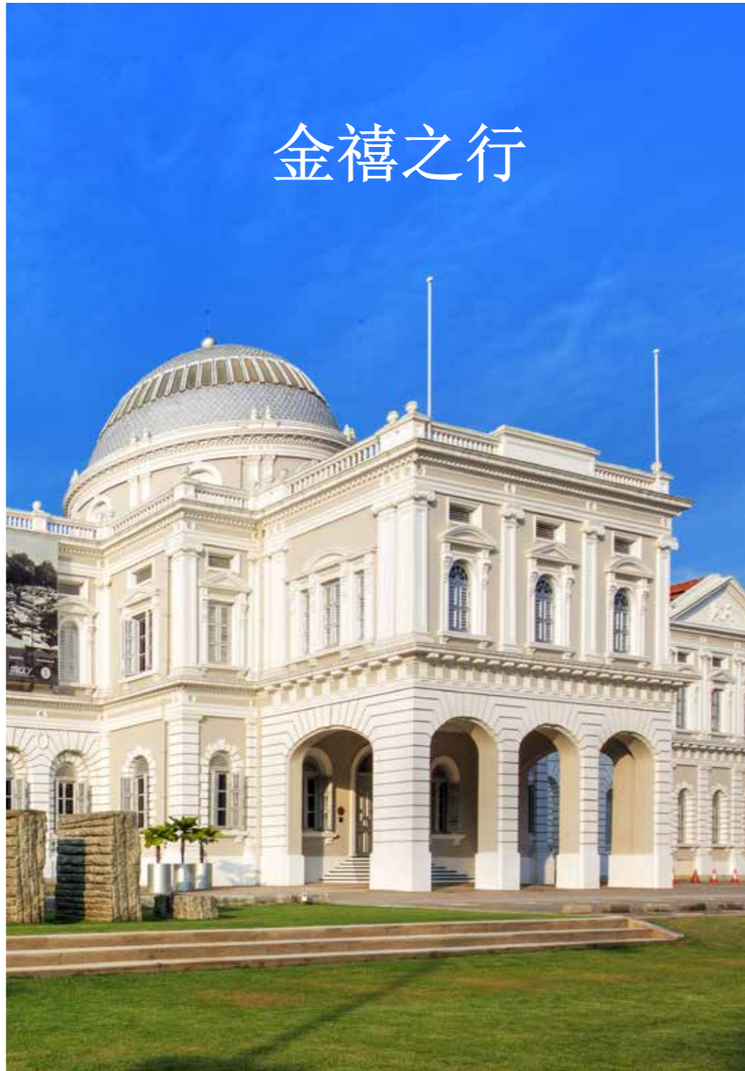
新加坡国家博物馆