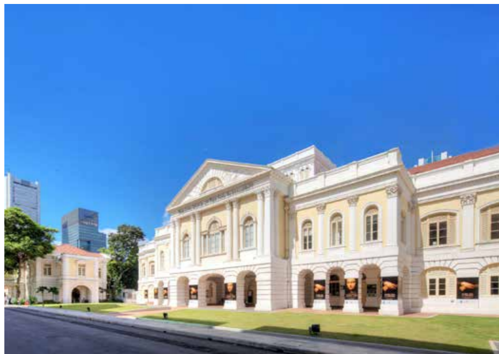
旧国会大厦艺术之家