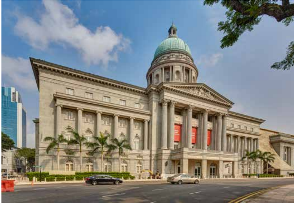
新加坡国家美术馆