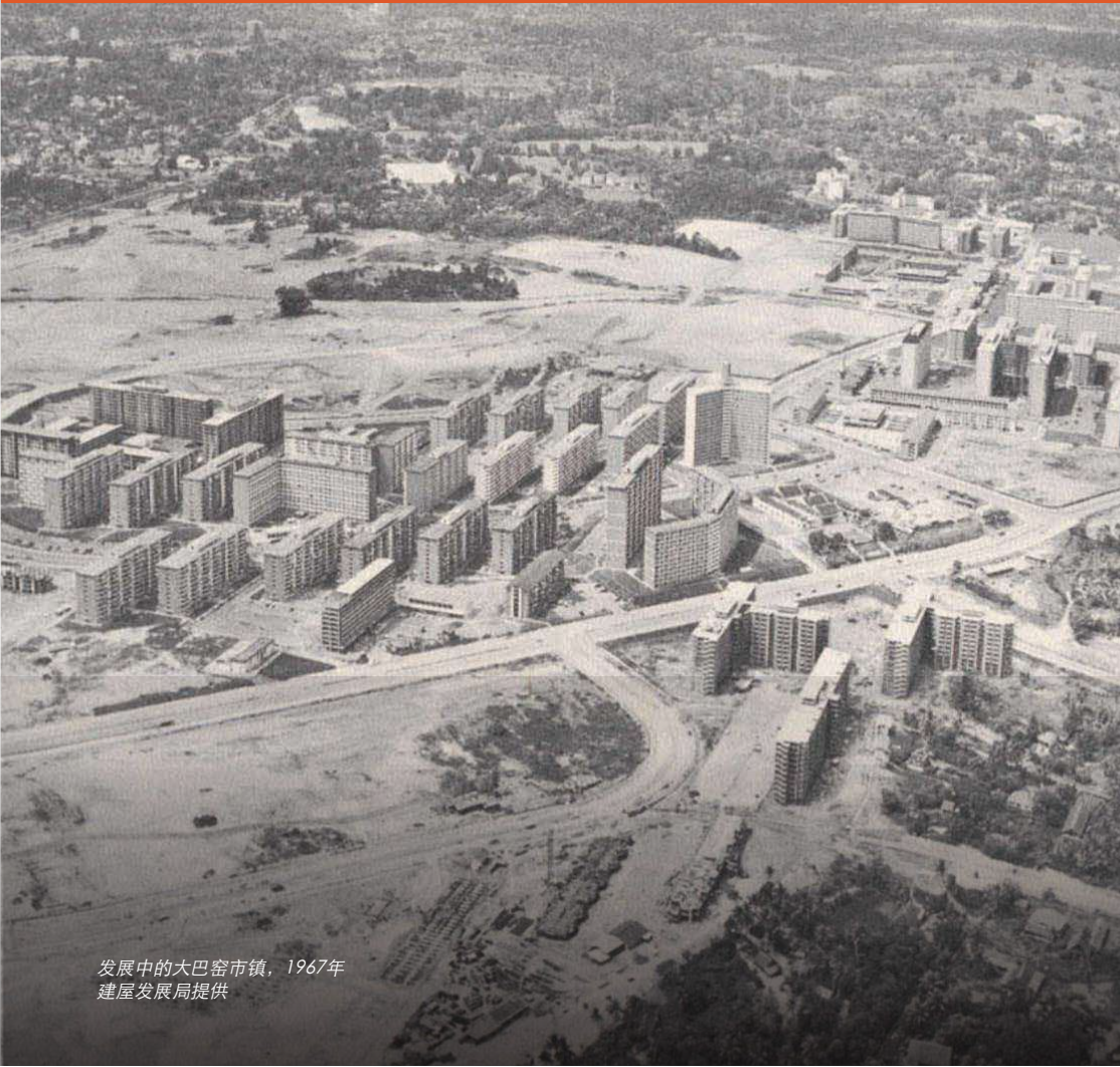
发展中的大巴窑市镇，1967年