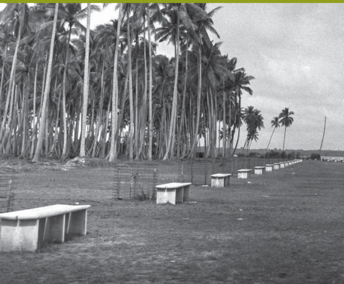
Pantai Pasir Ris, 1958