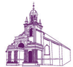
ORCHARD ROAD PRESBYTERIAN CHURCH