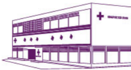
RED CROSS HOUSE