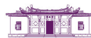
HOUSE OF TAN YEOK NEE