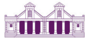
FORMER ORCHARD ROAD MARKET