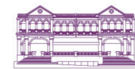
WINSLAND HOUSE II