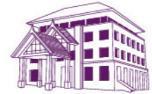
ROYAL THAI EMBASSY