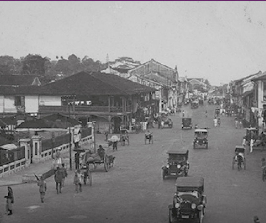
Orchard Road, 1930-an