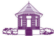
SINGAPORE BOTANIC GARDENS