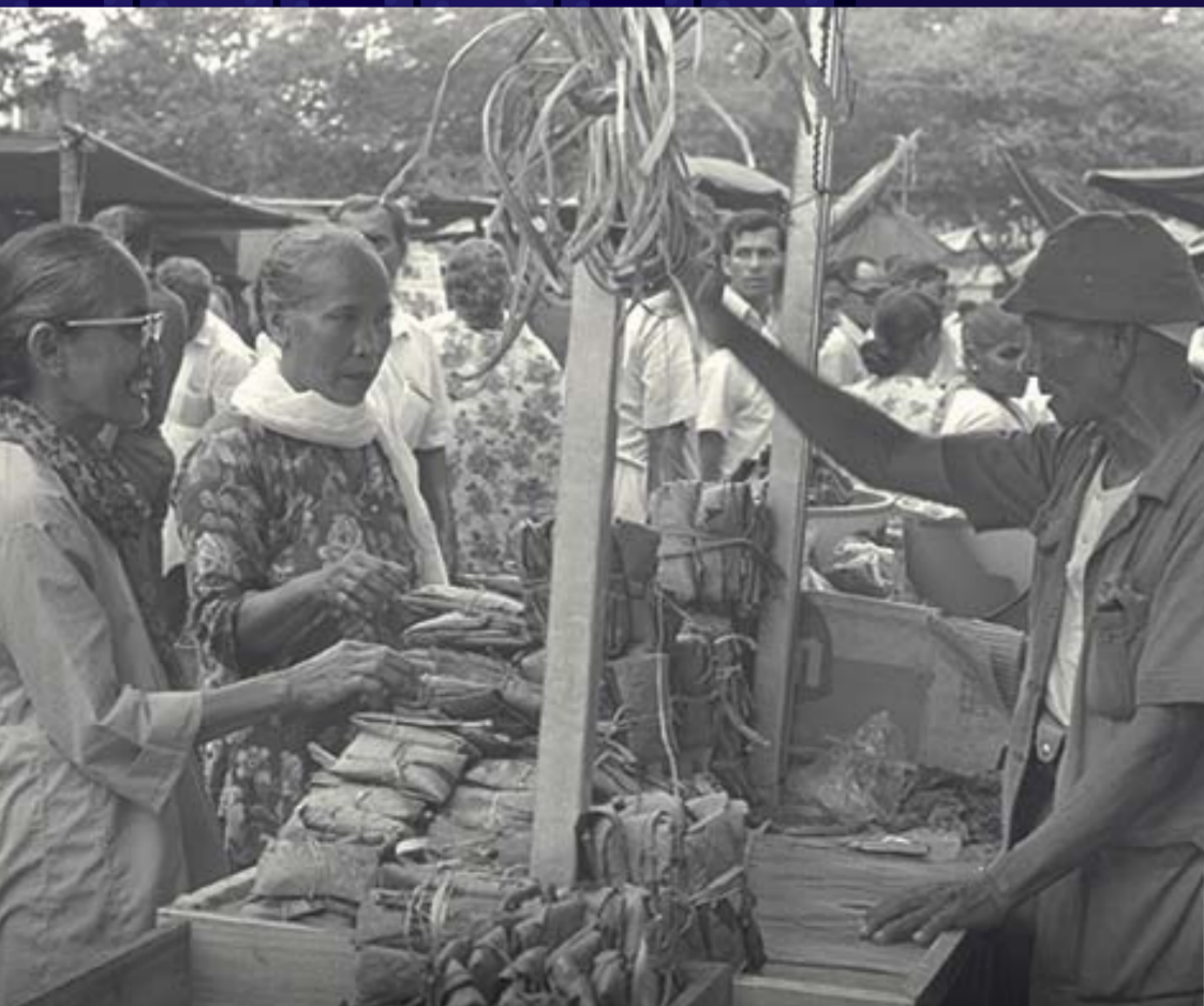
竹脚巴刹一个售卖“丹贝”(传统豆制品)的摊位。1971年