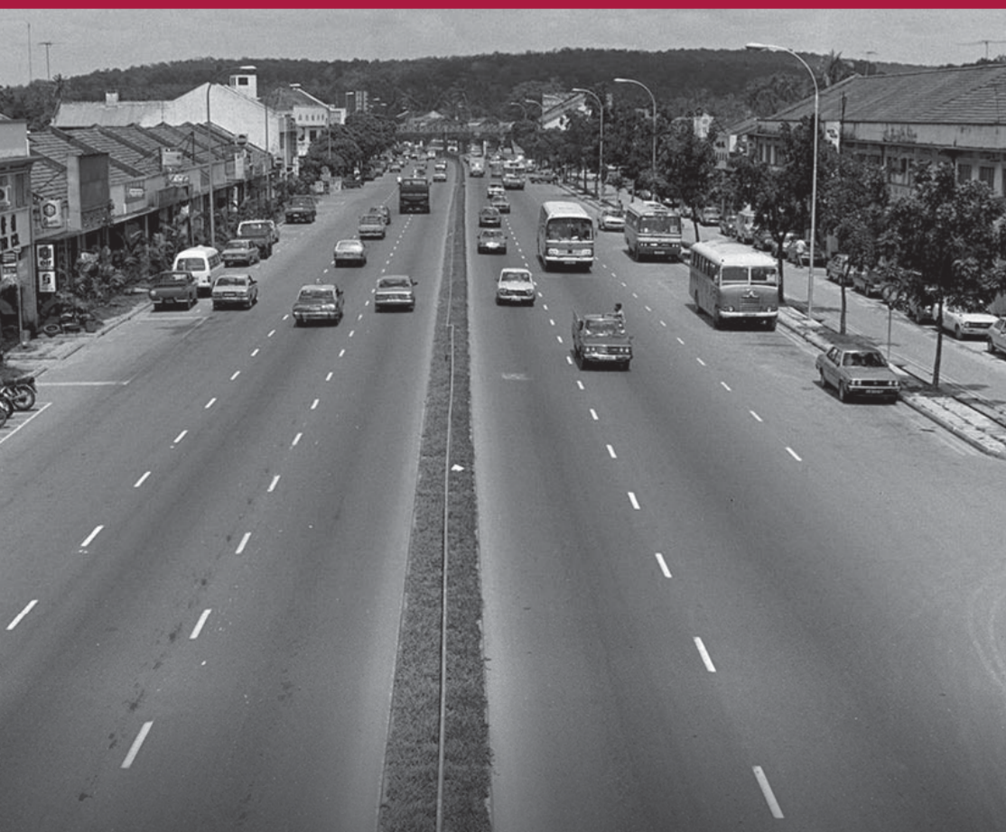
Upper Bukit Timah Road, 1982 Daripada Koleksi Lee Kip Lin. Hak cipta terpelihara. Lee Kip Lin dan Lembaga Perpustakaan Negara, Singapura 2016