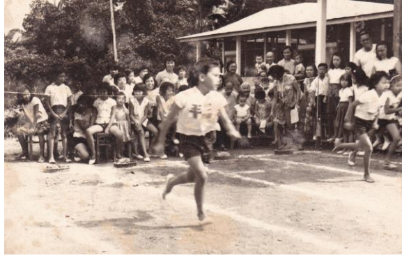
Hari Sukan di Sekolah Cheng Chi di Mandai, tahun 1950-an