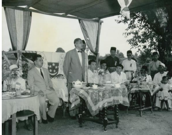
Yusof Ishak (1910-1970) berucap kepada penduduk Jalan Kranji, tahun 1961