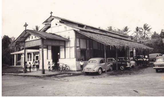
Gereja kecil St Anthony's di Mandai, tahun 1950-an Ihsan Cyprian Lim