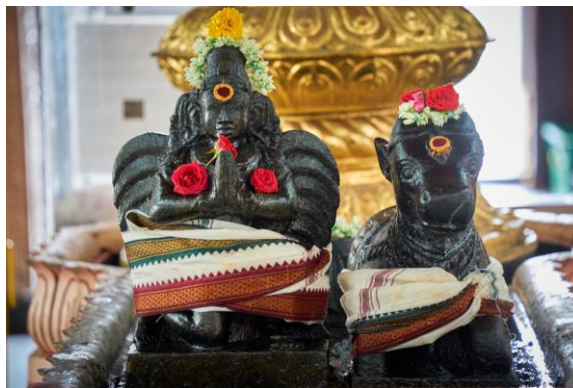
Dua tunggangan Dewa Siva-Krishna, Sri Garuda yang seperti burung (kiri) dan Sri Nandi yang merupakan lembu jantan (kanan), tahun 2022

Kranji War Cemetery and Kranji State Cemetery Tanah Perkuburan Perang Kranji dan Tanah Perkuburan Negara Kranji