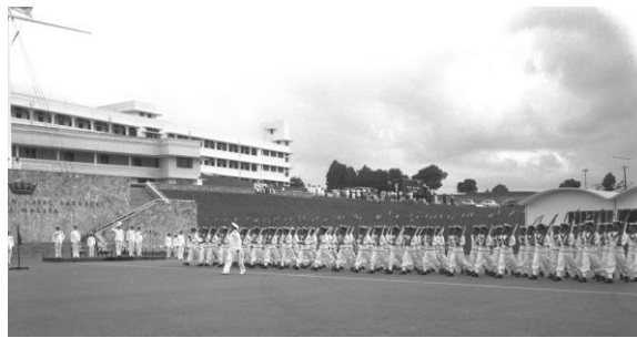
Perarakan istiadat di KD Malaya , tahun 1956

Hari ini, bekas Jeti Pangkalan Laut Malaysia menjadi sebahagian daripada Taman Pesisiran Woodlands, yang dibuka pada tahun 2011. Jeti yang telah diubah suai itu menampilkan sauh tambatan lama yang telah ditukar menjadi tempat duduk untuk pengunjung. Ia juga mempunyai bangsal lama, kini merupakan sebuah restoran, yang mengandungi sistem angkat terpelihara yang dahulunya digunakan untuk mengangkat dan membawa beban berat. Jeti ini merupakan tempat rekreasi dan memancing yang popular untuk penduduk Woodlands dan menawarkan pemandangan Koswe dan Selat Johor yang mengagumkan.