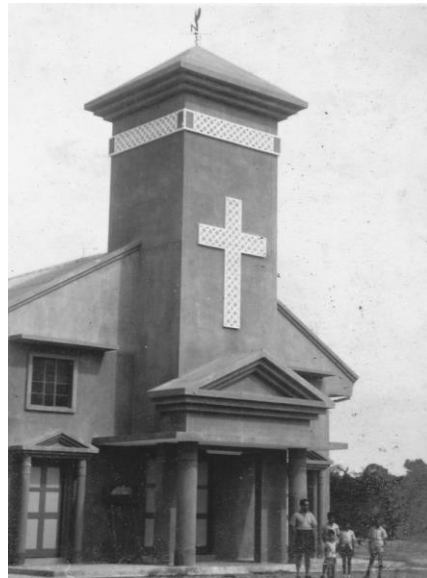
Bekas Gereja St Anthony of Padua di Stephen Lee Road, Mandai, tahun 1965