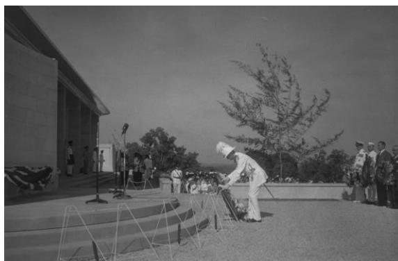
Gabenor Robert Black pada pembukaan Tugu Peringatan Singapura, tahun 1957