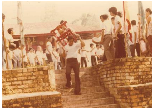
Perarakan di Kuil Shang Di Miao Chai Kong yang asal, tahun 1980-an