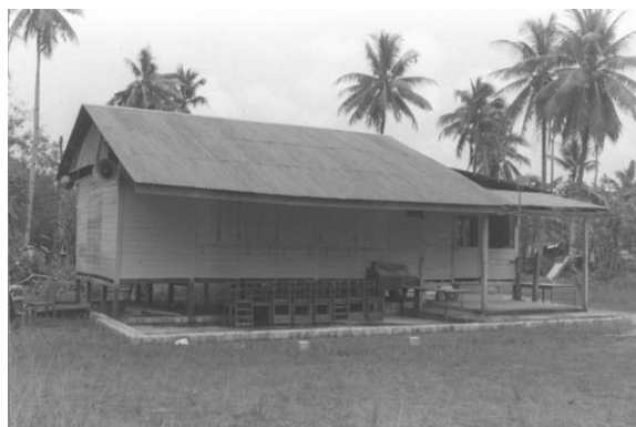
Sebelum Masjid An-Nur dibina, umat Islam di kawasan itu mendirikan solat di surau kecil seperti yang terdapat di Kampong Mandai Kechil, tahun 1986