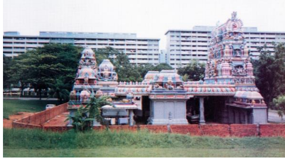
Kuil Sri Siva-Krishna yang baru siap, tahun 1996