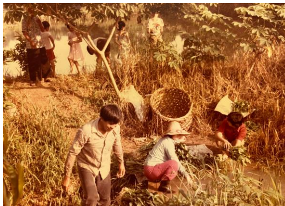
Penduduk kampung di Kampung Mandai Tekong, yang mempunyai banyak kolam tempat menternak ikan yang boleh dimakan, tahun 1970-an