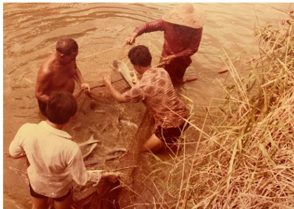
Penduduk kampung memancing di kolam ikan di Kampung Mandai Tekong, tahun 1970-an

Penduduk kedua-dua kampung ini telah ditempatkan semula pada tahun 1980-an apabila Woodlands menjalani pembangunan semula. Warisan Kampung Katolik Mandai kekal hingga sekarang di Gereja St Anthony of Padua, yang dibina pada tahun 1994 di Woodlands Avenue 1. Terdapat juga taman kejiranan di Woodlands Avenue 5 yang dipanggil Taman Mandai Tekong, yang mengimbas kembali satu lagi bekas kampung di kawasan itu. Hari ini, Penyambung Taman Ulu Sembawang melalui landskap luar bandar yang indah yang menawarkan pemandangan Woodlands seperti pada masa lalu.