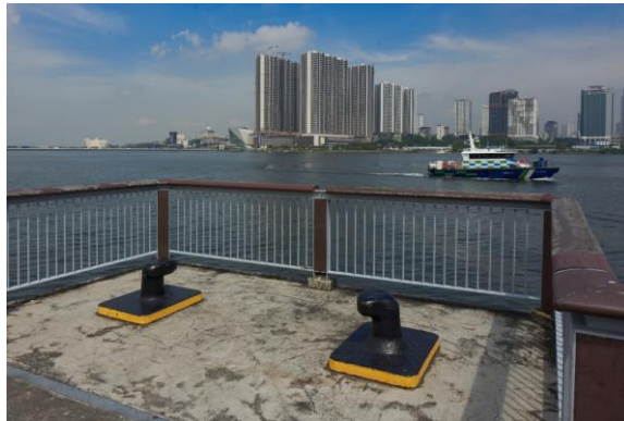
Bekas sauh tambatan yang digunakan untuk menambat kapal telah ditukar menjadi tempat duduk, tahun 2022