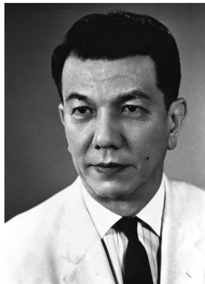
Dr Benjamin Sheares (1907-1981), tahun 1950-an