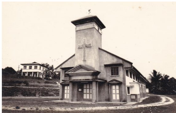
Gereja St Anthony of Padua yang pertama di Mandai, tahun 1960-an Ihsan Cyprian Lim