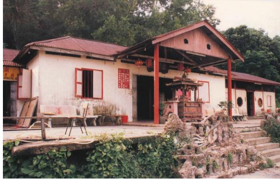
Kuil Hong Tho Bilw yang asal di Kampong Hock Choon, tahun 1982