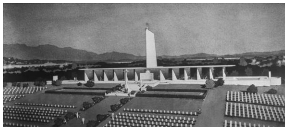
Tanah Perkuburan Perang Kranji, tahun 1957

Tanah Perkuburan Negara Kranji, yang terletak betul-betul di luar Tanah Perkuburan Perang Kranji, telah ditubuhkan oleh pemerintah Singapura pada tahun 1970 untuk individu yang telah “membuat sumbangan penting kepada kemajuan negara”. Tanah perkuburan itu mengandungi kubur dua mantan presiden: Allahyarham Yusof Ishak, yang merupakan Yang di-Pertuan Negara (ketua negara) Singapura dari tahun 1959-1965 dan Presiden pertama dari 1965-1970; dan Dr Benjamin Sheares, Presiden kedua Singapura dari tahun 1971-1981.