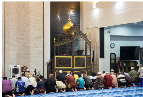
Mimbar berukir masjid dengan kubah emasnya, tahun 2022 Ihsan Lembaga Warisan Negara