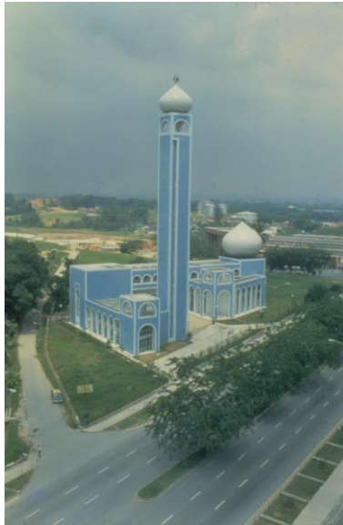
Masjid An-Nur, tahun 1985