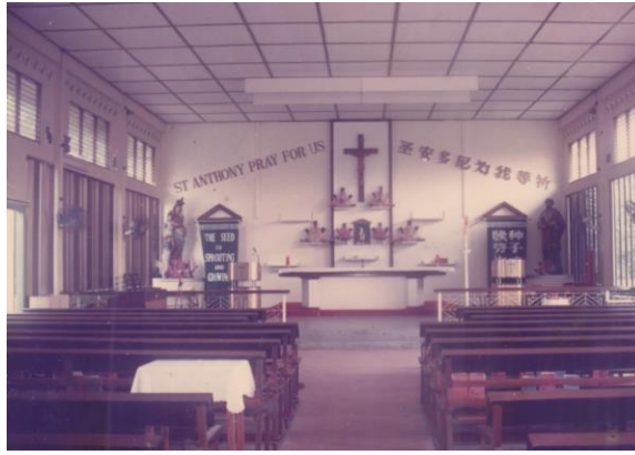
Bahagian dalam Gereja St Anthony of Padua yang pertama, tahun 1990 Ihsan Henry Cordeiro