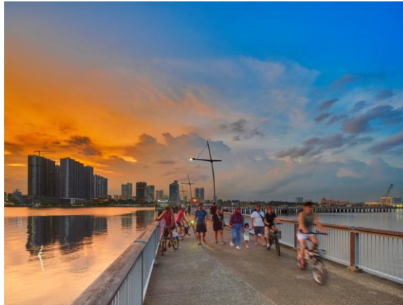
Bekas Jeti Pangkalan Laut Malaysia, yang kini menjadi sebahagian daripada Taman Pesisiran Woodlands, tahun 2022