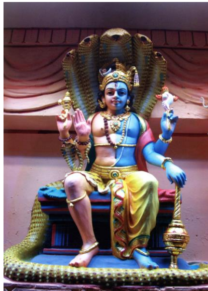
Ukiran Dewa Siva-Krishna di kuil, tahun 2008