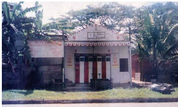
Bangunan kuil sementara yang asal di Marsiling, tahun 1980-an

Kuil itu membuka tambahan empat tingkat pada Mac 2022, yang merangkumi dewan serba guna, studio tarian, bilik darjah dan teres bumbung. Orang ramai daripada semua kaum dan agama dialu-alukan untuk menggunakan kemudahan ini. Di samping itu, kuil tersebut mengadakan perarakan jalanan tahunan, di mana ketua dewa diangkut dengan kereta kuda untuk memberkati penganut di sekitar Woodlands.