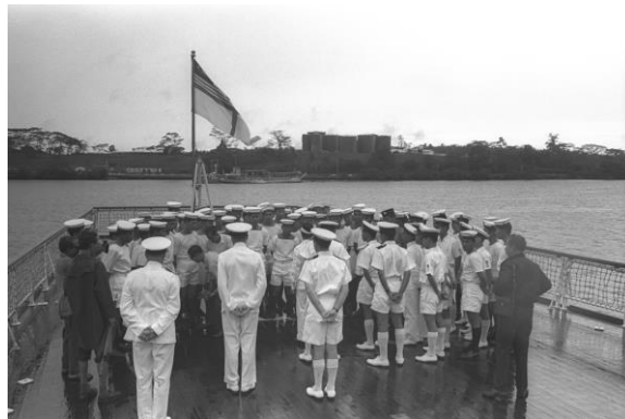
Jeti Ruthenia (kini dirobuhkan) digunakan oleh tentera laut Malaysia sebelum Jeti Pangkalan Laut Malaysia siap, tahun 1964