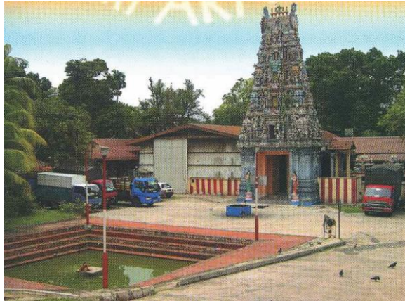
Kuil dan kolam asal di Woodlands Road, tahun 1980-an