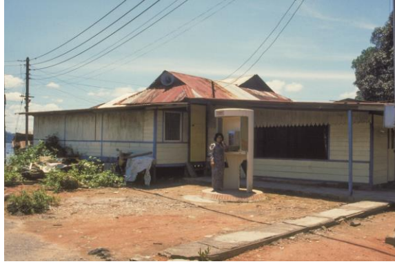
Surau di Kampong Lorong Fatimah, bekas kampung berhampiran Koswe, tahun 1989