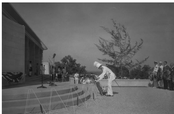
总督柏立基爵士为新加坡纪念碑揭幕，1957年