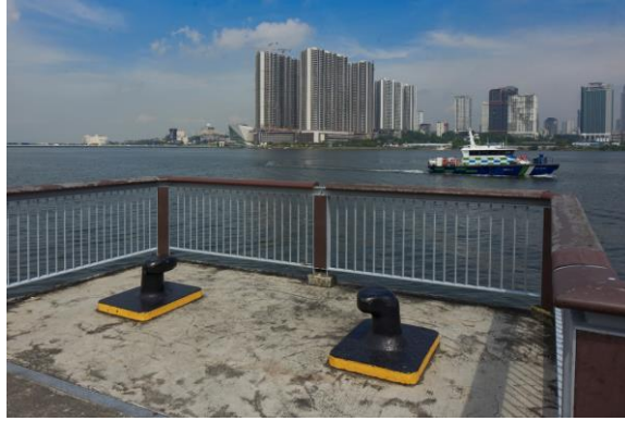
以前用来系泊缆绳的系缆桩，如今改造成供人们歇脚的座椅，2022年 国家文物局提供