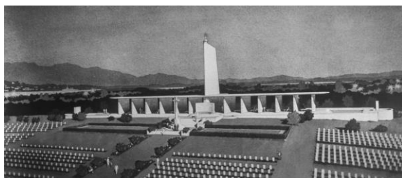
克兰芝阵亡战士公坟，1957年

克兰芝国家公墓位于克兰芝阵亡战士公坟外，由新加坡政府于1970年设立，以纪念“为国家发展做出重要贡献”的人士。两位新加坡前总统尤索夫和薛尔思医生长眠于此。尤索夫是1959年至1965年间的自治邦元首，并在1965年独立后至1970年成为第一任总统；薛尔思医生则是1971年至1981年间的第二任总统。