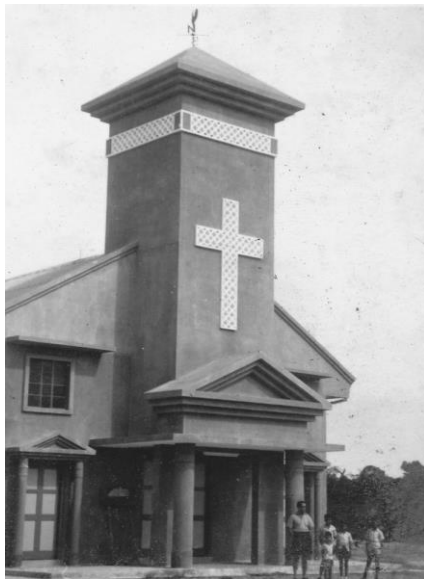
原坐落在史蒂芬李路的圣安多尼堂，1965年