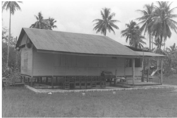
安努尔回教堂建成之前，住在这一区的回教居民在小祈祷室祈祷，如图中的甘榜万礼 克基小祈祷室，1986年