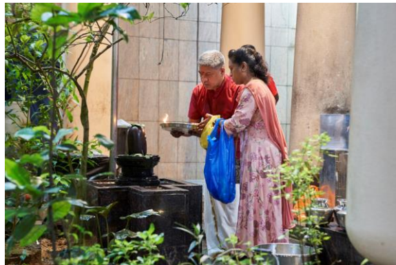
印度教徒在“无月日”进行祷告与供奉仪式，2022年 国家文物局提供