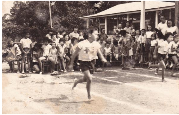
万礼的增志学校举行运动会，1950年代