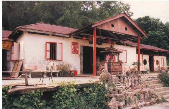
原坐落在福春村的凤图庙，1982年

1980年代，这两座庙宇因各自所在的农村重建发展而迁至马西岭工业区现址。如今，它们仍为兀兰的道教社群服务，接受他们祈福，以及庆祝重要节日。