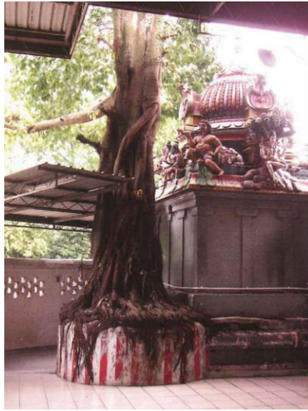
原坐落在兀兰路的印度庙有一棵菩提树，1980年代至1990年代