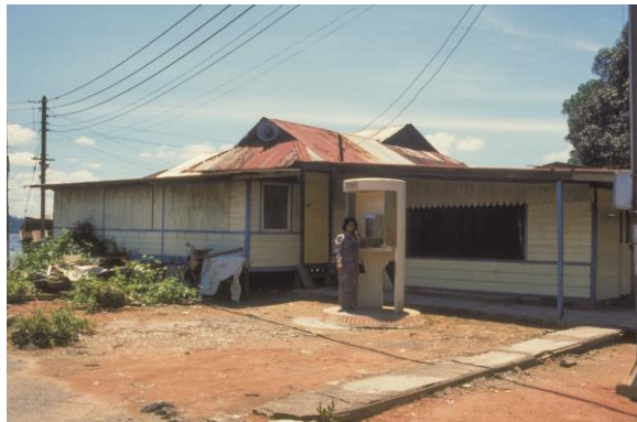
位于长堤附近的甘榜罗弄花蒂玛的小祈祷室，1989年