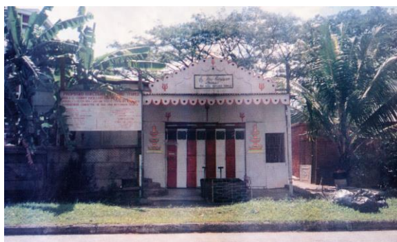
在马西岭的临时庙宇，1980年代

2022年3月，西法克萨那庙增建四层楼，设立多功能礼堂、舞蹈室、教室和屋顶花园，欢迎所有种族和宗教的民众使用。此外，印度庙每年都会举办巡游，让乘坐战车的主神环绕兀兰，保佑民众。