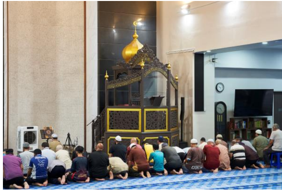
回教堂内雕刻精致的讲坛和金色圆顶，2022年