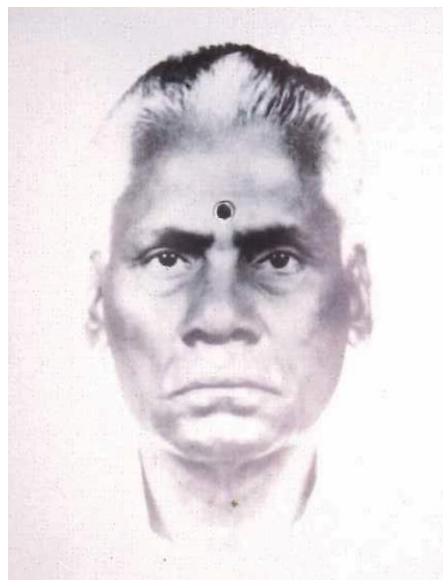
卡提拉苏捐赠印度庙在兀兰路原址的土地，1960年代至1970年代