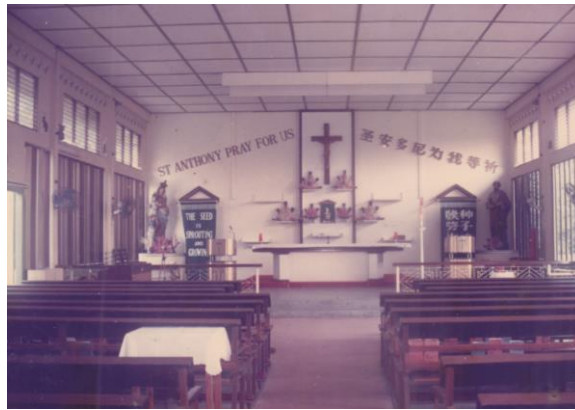
第一座圣安多尼堂的内部设计，1990年