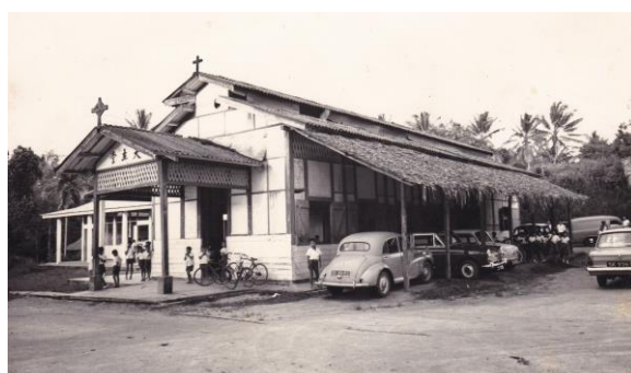
位于万礼的圣安多尼堂，1950年代

圣安多尼堂如今仍为兀兰的天主教社群服务。它在 2019年至2020年间 展开翻新工程，建造了 12个拱门 ，象征耶稣十二门徒。入口处伫立着一尊圣安多尼铜像。教宗若望保禄二世于 1986年 访问新加坡期间主持弥撒时使用过的祭台，目前就放在圣安多尼堂的礼拜堂。