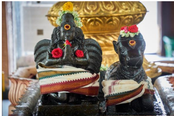
西法克萨那神的两个坐骑——大鹏金翅鸟迦楼罗（左）和公牛南迪（右）。