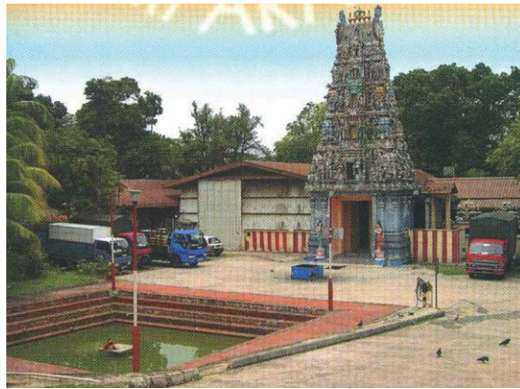
原坐落在兀兰路的印度庙和净化池，1980年代

如今，阿拉沙克沙里西凡庙为所有印度教徒服务，除了著名的节日如屠妖节和淡米尔新年，这座庙宇也庆祝“无月日”和湿婆节。印度教徒在“无月日”这一天为祖先进行特别的祷告和供奉仪式，在湿婆节则通过舞蹈敬奉宇宙与毁灭之神湿婆。