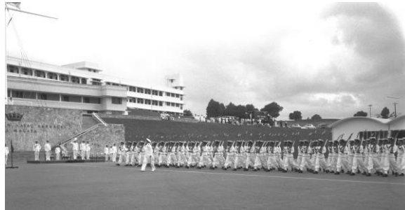
马来亚皇家海军基地举行检阅礼，1956年

如今，旧马来西亚基地码头已成为兀兰海滨公园的一部分。公园于2011年开放，翻新后的码头保留了系缆桩，并将它们改造成供人们歇脚的座椅。另一处旧棚子，如今是一家餐馆，里头还保存了过去用来提举和搬运重物的卷扬机。码头是兀兰居民喜爱的休闲和垂钓胜地，可欣赏长堤和柔佛海峡的壮丽景色。