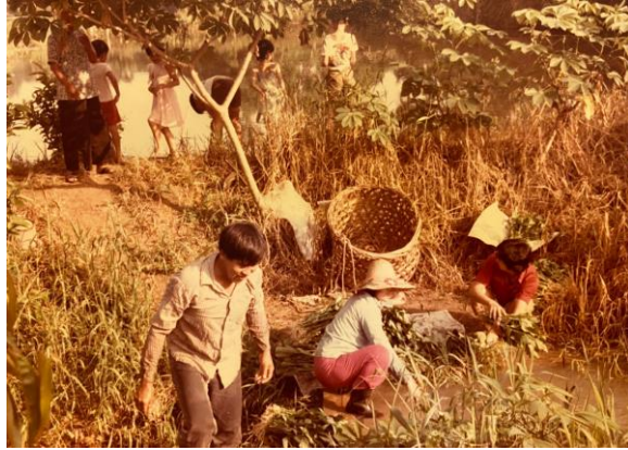
万礼泽光村的村民养殖食用鱼，1970年代 陈美华和林世平提供