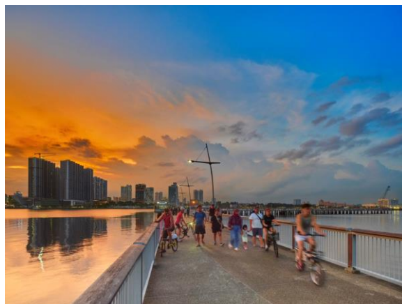
旧马来西亚基地码头，现为兀兰海滨公园的一部分，2022年