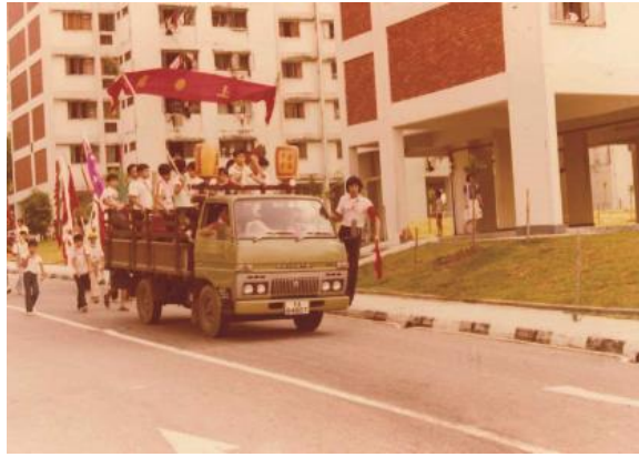
在兀兰举办的神祇巡境游行，1980年代