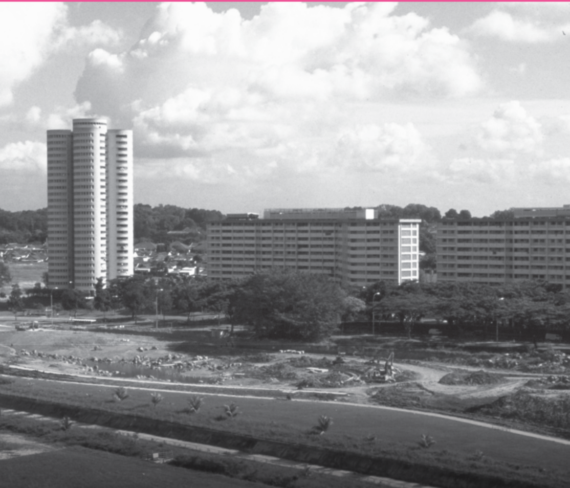
Pemandangan bandar baharu Ang Mo Kio dengan Blok 259 di sebelah kiri, 1987