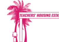
TEACHERS' HOUSING ESTATE

All information contained in this trail map is provided in good faith, and every reasonable effort has been made to ensure that the information is accurate and up to date at time of print. Accordingly, NHB makes no warranty or representation relating to the trail map and all information contained therein, and users relying on any of the information contained in the trail map shall do so at their own risk and diligence.