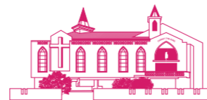
CHURCH OF CHRIST THE KING