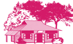
FORMER CHENG SAN