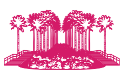
ANG MO KIO TOWN GARDEN WEST