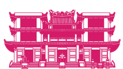
ANG MO KIO JOINT TEMPLE