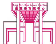
ANG MO KIO TOWN CENTRE