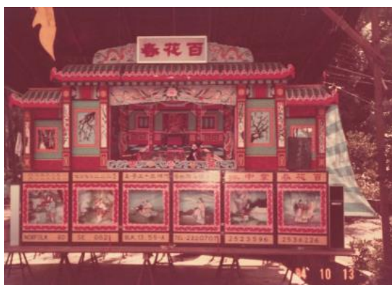
Pertunjukan boneka yang diadakan semasa majlis perayaan di Feng Shan Tang di kampung Lak Xun, tidak bertarikh