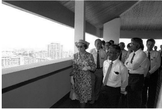
Ratu Elizabeth II semasa lawatannya ke Ang Mo Kio di Blok 710, 1989