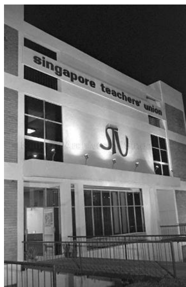
Pusat Guru yang baru dibina di estet itu juga menempatkan Kesatuan Guru Singapura, 1975