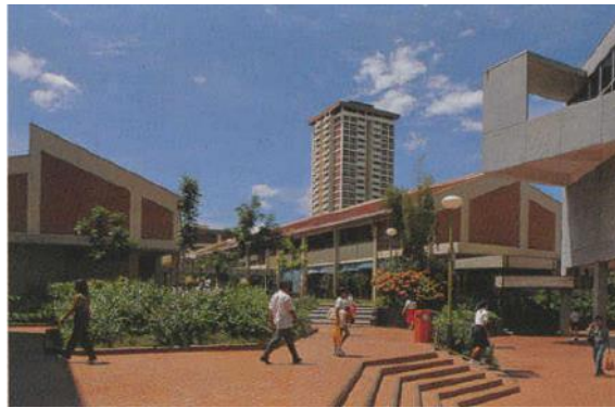
Pusat Bandar Ang Mo Kio dengan Blok 710 di latar belakang, 1981