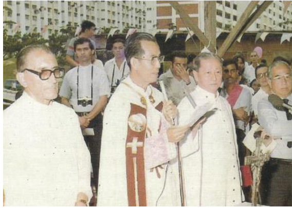
Upacara peletakan batu asas, 1981