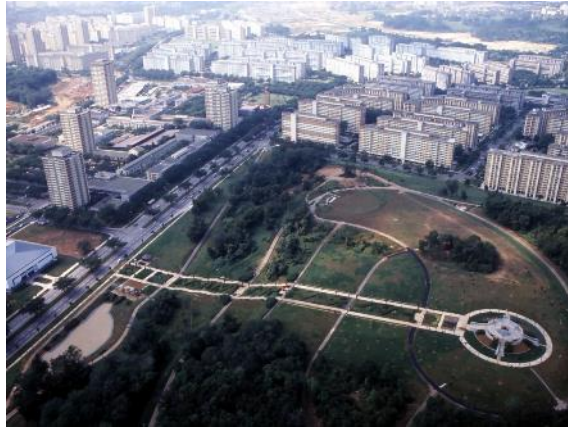
Foto dari udara Ang Mo Kio Town Garden West, 1982