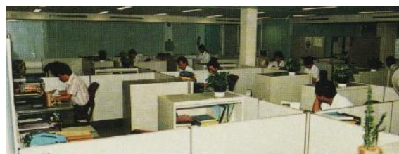
Pegawai Majlis Bandaran Ang Mo Kio East yang bekerja di bangunan itu, 1989