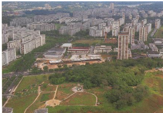
Foto dari udara menunjukkan Ang Mo Kio Town Garden East yang baru dibina, 1981