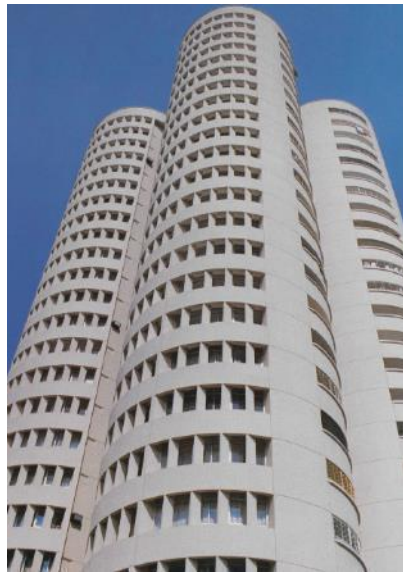
Blok 259 apabila ia baru dilancarkan, 1981