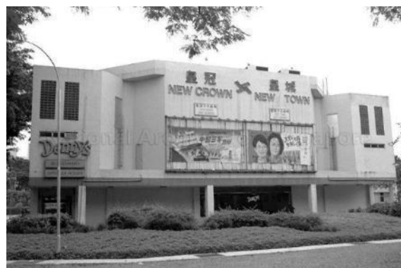
Pawagam New Town dan New Crown, 1984