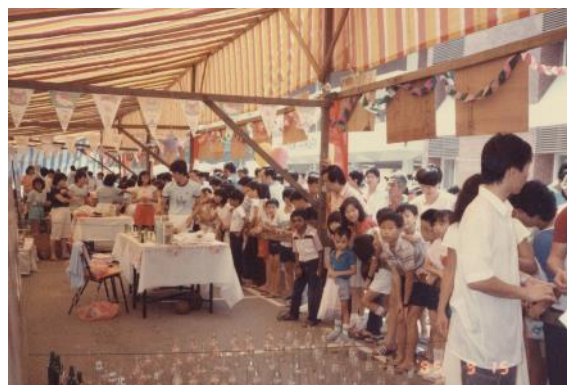
Karnival anjuran bersama majlis bandaran dan Jawatankuasa Penduduk untuk penduduk yang tinggal di Ang Mo Kio, 1986