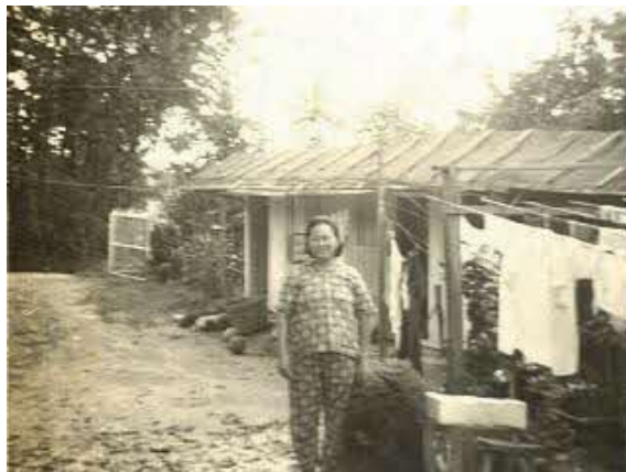
Penduduk kampung di hadapan rumahnya di Cheng San, tidak bertarikh