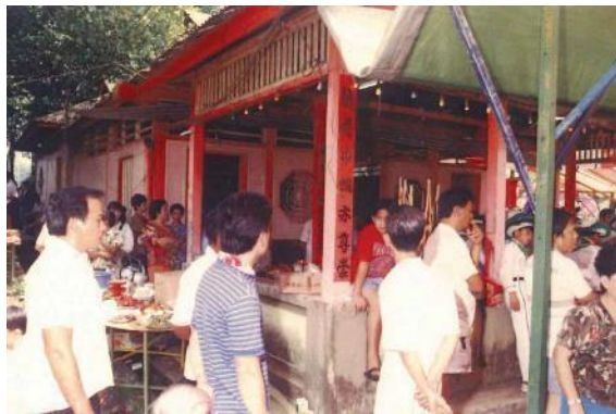
Majlis penempatan semula diadakan di Longxuyan Jingshuiguan, 1989