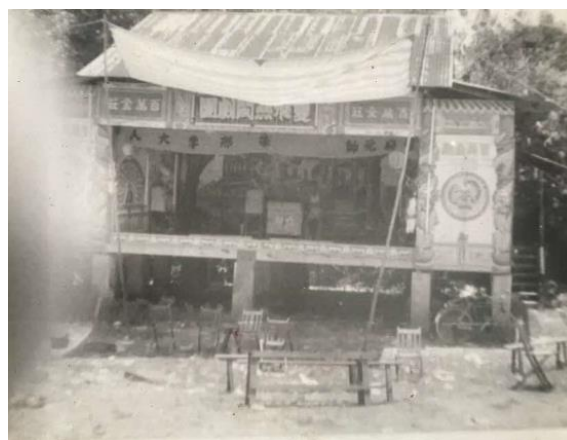
Pentas opera di lokasi bekas Gao Lin Gong di Cheng San Road, tidak bertarikh

Ditubuhkan pada tahun 1950-an, Leng San Giam telah ditubuhkan oleh pendatang bernama keluarga Chew, dari daerah Yongchun, wilayah Fujian. Mereka membina kuil mereka di bekas Cheng San Road, yang selari dengan Ang Mo Kio Ave 3 yang ada kini. Didedikasikan kepada dewa Fa Chu Gong, kuil itu terkenal dengan kejadian yang dianggap mukjizat dan ramalan "nombor bertuah" untuk berjudi.