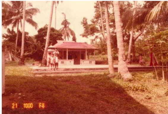
Bangunan asal Sam Ann Fu dan persekitarannya di kampung Lak Xun, tidak bertarikh

Ditubuhkan pada tahun 1989, Persatuan Tokong Hong San Chin Huat terdiri daripada tiga kuil lama yang ditubuhkan oleh pendatang dari daerah Nan An, wilayah Fujian. Kuil-kuil itu adalah Feng Shan Tang, Jin Fa Dian dan Quan Sheng Gong. Kuil-kuil ini telah ditubuhkan di Lak Xun juga dan bekas penduduk kampung terus berkumpul di sini hari ini.