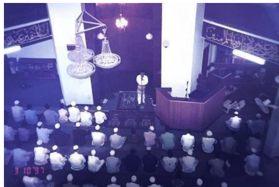
Umat Islam berkumpul di masjid pada hari pertama Hari Raya, 1997 Ihsan Masjid Al-Muttaqin