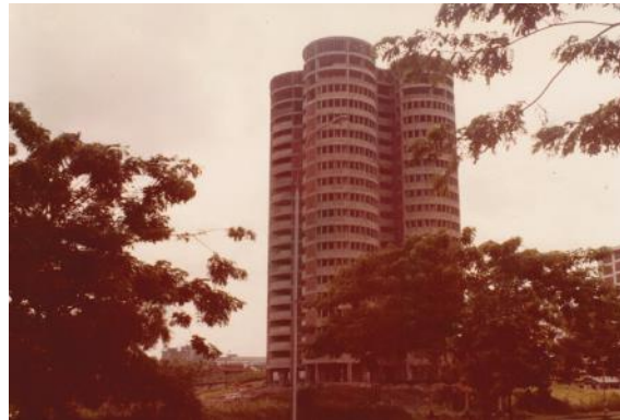
Blok 259 semasa pembinaannya, 1981

Digelar "Blok Klover" kerana persamaannya dengan tumbuh-tumbuhan itu apabila dilihat dari atas, Blok 259 telah menjadi ikon Ang Mo Kio, dan unitnya menjadi buruan hari ini.