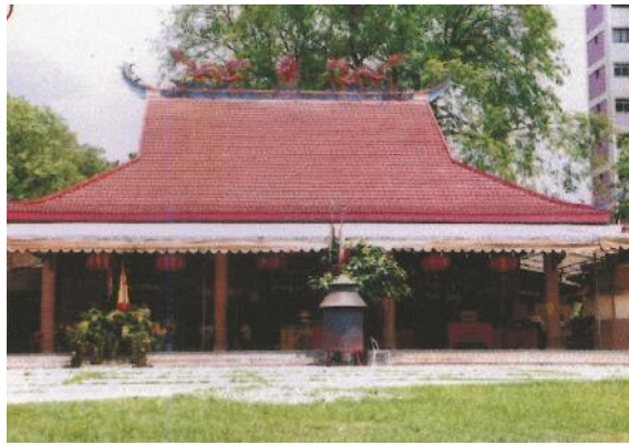
Bangunan kuil bersama yang asal di Ang Mo Kio Ave 1, 1983