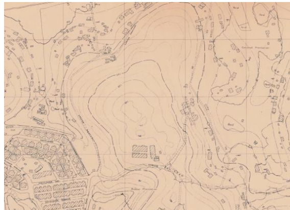
Peta yang menunjukkan topografi Ang Mo Kio sebelum pembangunan semula, di mana bukit yang dibina Ang Mo Kio Town Garden West di atasnya boleh dilihat di tengah, 1970

Bagi penduduk Ang Mo Kio, taman bandar itu bukan sahaja tempat popular untuk beriadah dan bersenam, malah juga tempat kegemaran untuk menyaksikan rama-rama. Pada tahun 1987, Kelab Nyanyian Burung Kebun Baru, gelanggang nyanyian dan pertunjukan burung terbesar di Singapura yang mampu menampung lebih daripada seribu sangkar, telah ditubuhkan di sebelah barat taman itu.