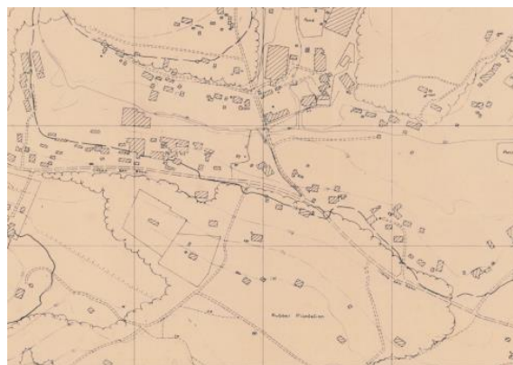
Peta yang menunjukkan butiran kawasan di sepanjang Cheng San Road berhampiran Serangoon Garden yang ada kini, 1970

Hari ini, pelawat masih boleh menemui pokok getah dan buah-buahan di taman itu, sejak zaman perkampungan Cheng San. Arca benih getah juga menghiasi laluan pejalan kaki, mengimbas kembali zaman silam kawasan tersebut.