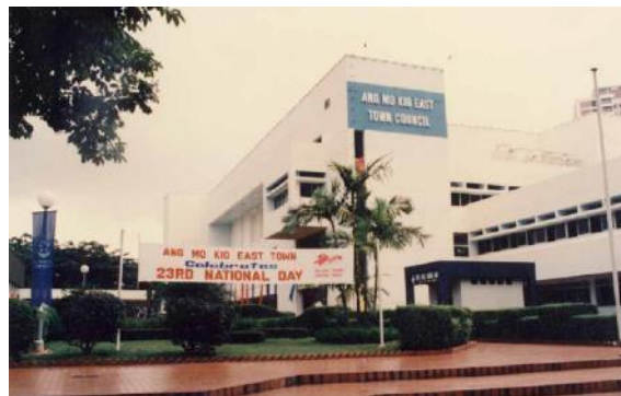
Bangunan pejabat Majlis Bandaran Ang Mo Kio East, 1988

Program perintis itu dianggap berjaya dan Akta Majlis Bandaran telah diluluskan pada tahun 1988. Hari ini, majlis bandaran terus memainkan peranan penting dalam mengekalkan estet perumahan awam kita.