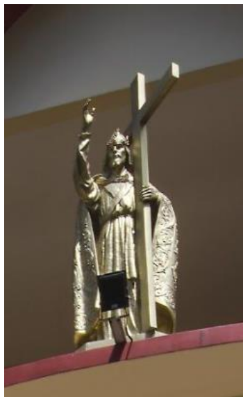
Patung Raja Jesus Christ di hadapan gereja, 2023