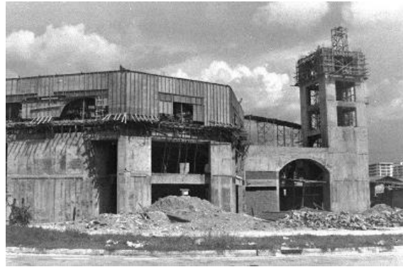
Masjid Al-Muttaqin dalam pembinaan, 1979