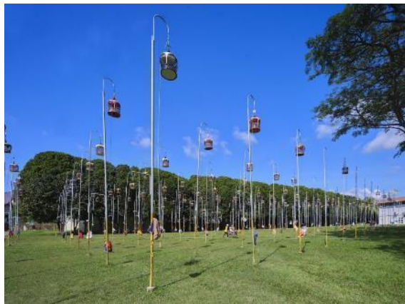
Tiang nyanyian burung di Kelab Nyanyian Burung Kebun Baru, 2023