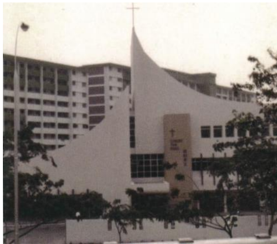
Bangunan gereja asal apabila ia pertama kali dibuka, 1982