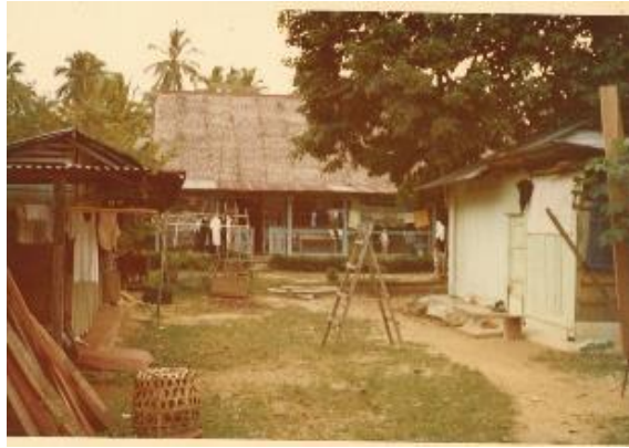
Rumah kampung di Cheng San, tidak bertarikh