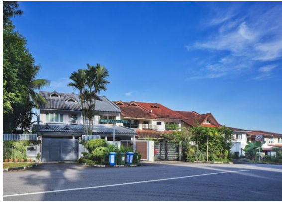
Munshi Abdullah Avenue di Teachers' Housing Estate, dinamakan sempena nama seorang penulis Malaya yang mengisahkan zaman penemuan Singapura, 2023 Ihsan Lembaga Warisan Negara