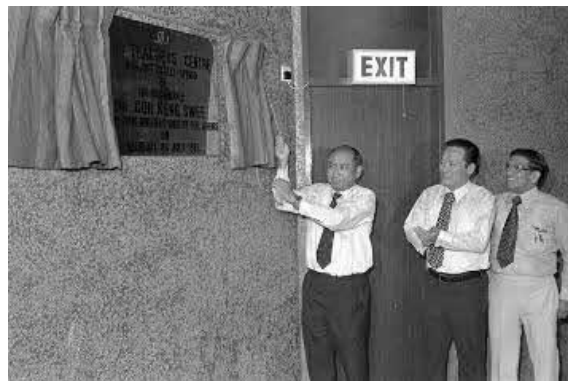
Timbalan Perdana Menteri dan Menteri Pertahanan Goh Keng Swee membuka plak pada pembukaan rasmi Pusat Guru, 1975