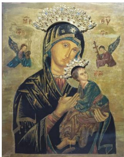
Ikon Mother of Perpetual Help di tempat kudus gereja, 2023